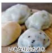
いさなりふたもち