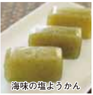
海味の塩ようかん