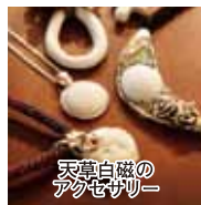
天草白磁のアカセザリ