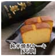
純米焼酎ケーキ「天草」