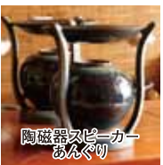
陶磁器スピーカー あんぐり