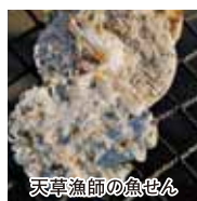
天草漁師の魚せん