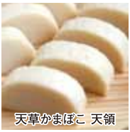
天草かまぼこ 天領