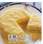
天草いちじく フロマージュ