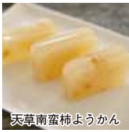
天草南蛮柿ようかん