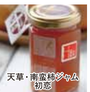
天草・南蛮柿ジャム 初恋