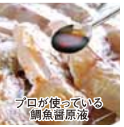
プロが使っている 鯛魚醤原液