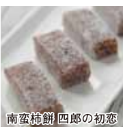
南蛮柿餅 四郎の初恋