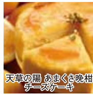
天草の陽 あまくさ晩柑 チーズケーキ