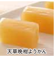
天草晩柑ようかん