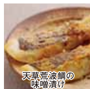
天草荒波鯛の味噌漬