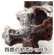
四郎の初恋シヨコラ